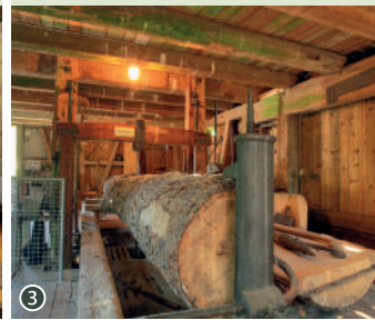
① - ③ Sägmühlmuseum